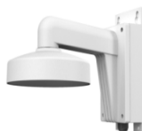
DS-1272ZJ-110B Настенный кронштейн