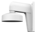
DS-1272ZJ-110 Настенный кронштейн