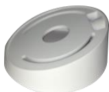
DS-1259ZJ Потолочное крепление